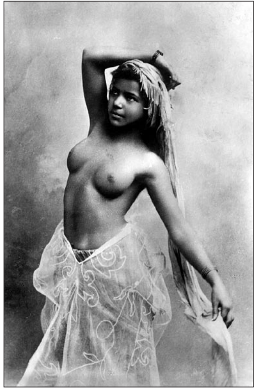
7. märtsil 1934 Casablancast Werner Kohvikusse saadetud postkaart “Afrique du Nord. Jeune danseuse”, trükitud Algeris.