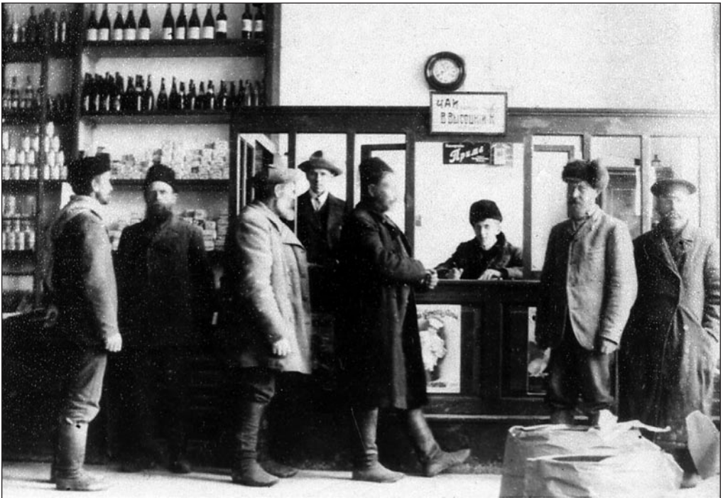
Kaupluse sisevaade Abhaasia eesti külas 1920.–1930. aastatel. EFA 0-154285