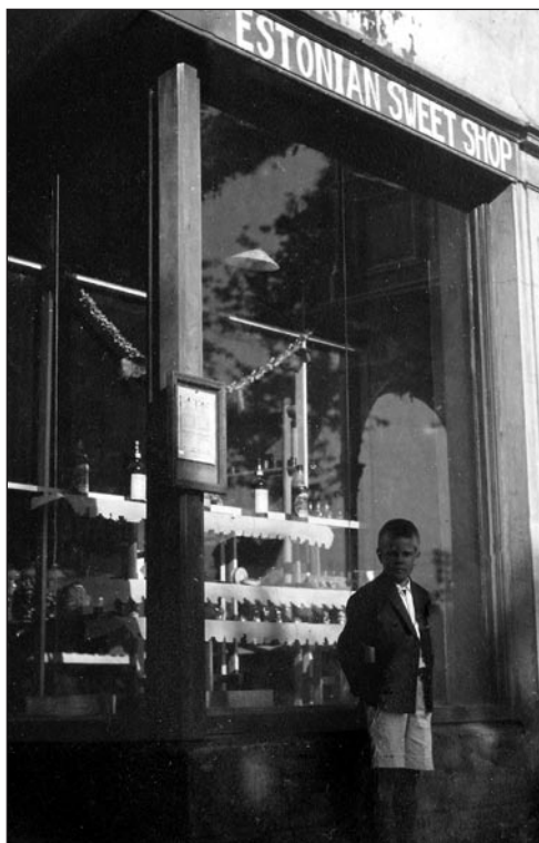
J. Tilgi maiustuste kauplus LAV-s 1931. a. EFA A-61-27