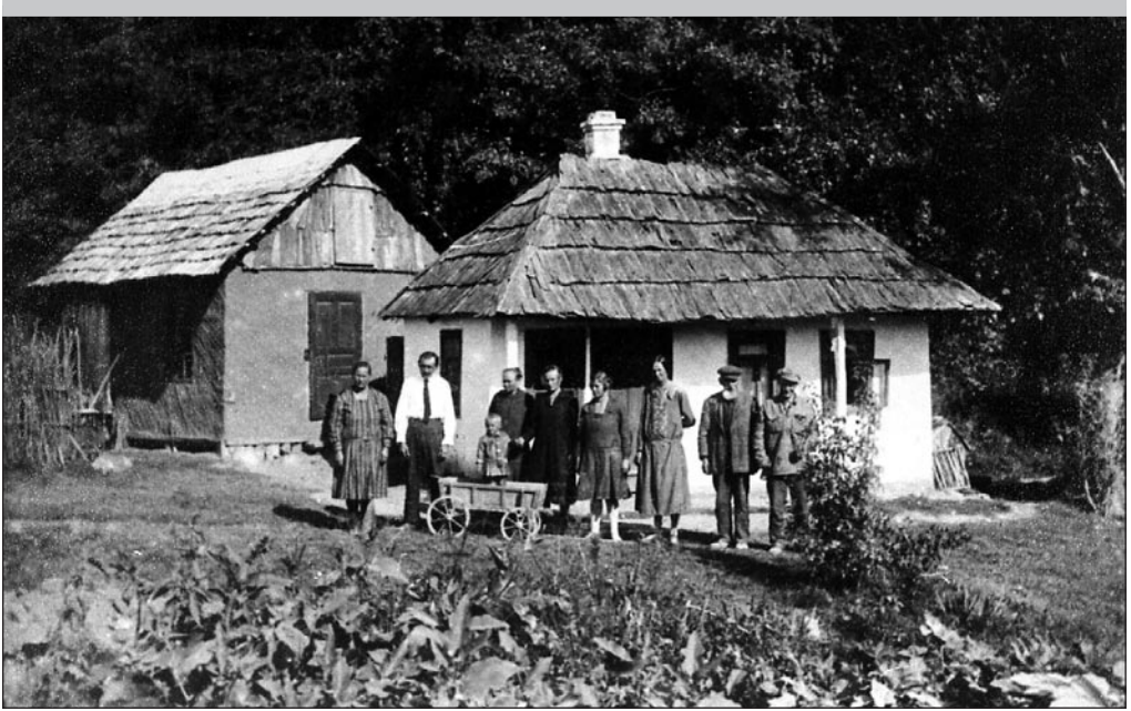
Vaade eestlaste külale Abhaasias 1920.–1930. aastatel.

M ie fotokogu toetab küll seda Hemingway väidet. Et rohkem on teada ja räägitud Teise maailmasõja aegsest sunnitud lahkumisest, siis seekord on valik tehtud varasemast ajast, millest pole ehk nii palju teada, ehkki tegelikult läksid eestlased erinevatel põhjustel uut kodu otsima varemgi.