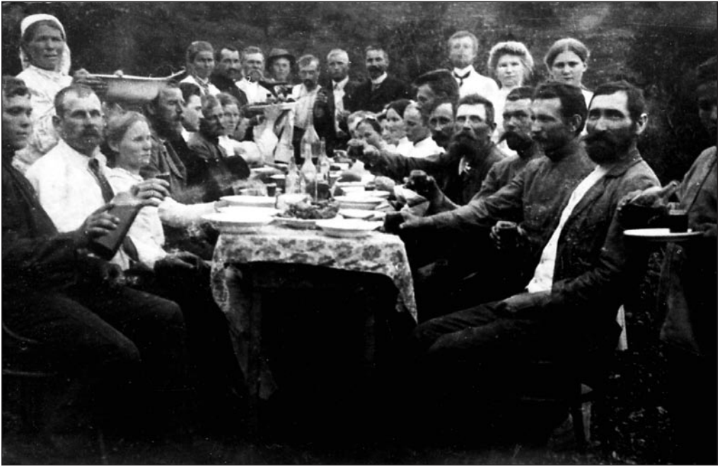
Peolaus. EFA 0-154337