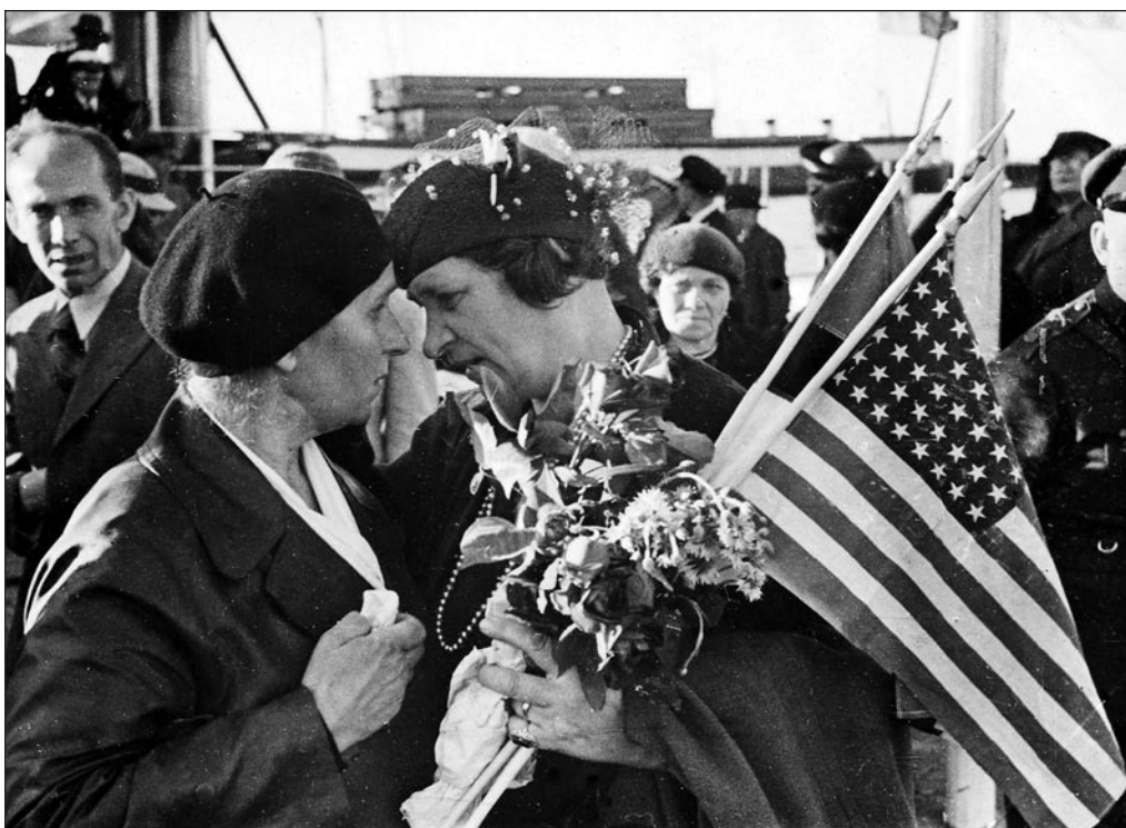
USA-st saabunud 1932. a. EFA A-63-103