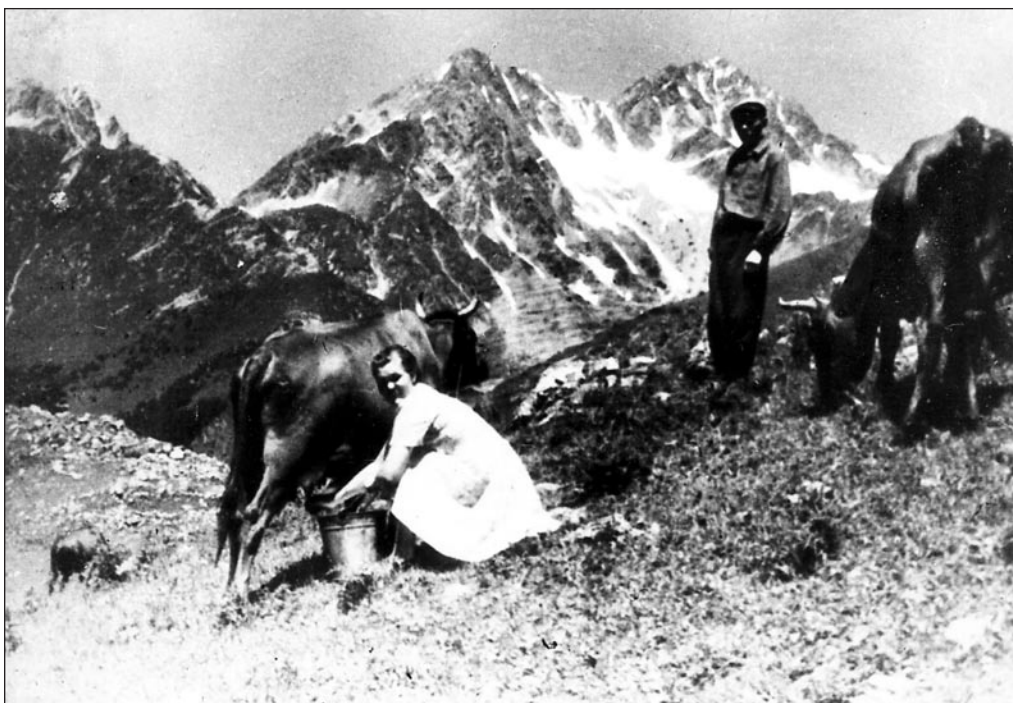
Lehmalüps mägedes 1920.–1930. aastatel. EFA 0-154335