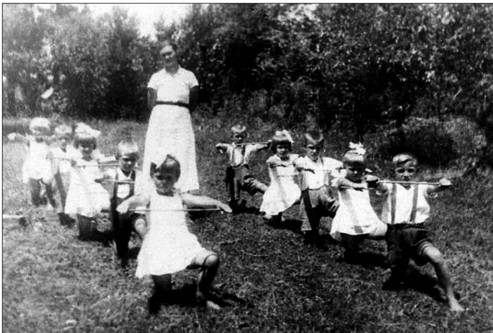
Lasteiaialapsed kasvatajaga eesti külas Abhaasias 1935. a. EFA 0-154281