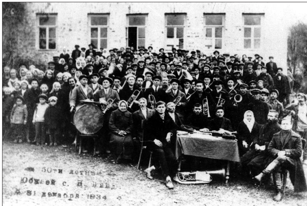
Alam-Linda 50. aastapäeva tähistamine 31.12.1934. EFA 0-154 261