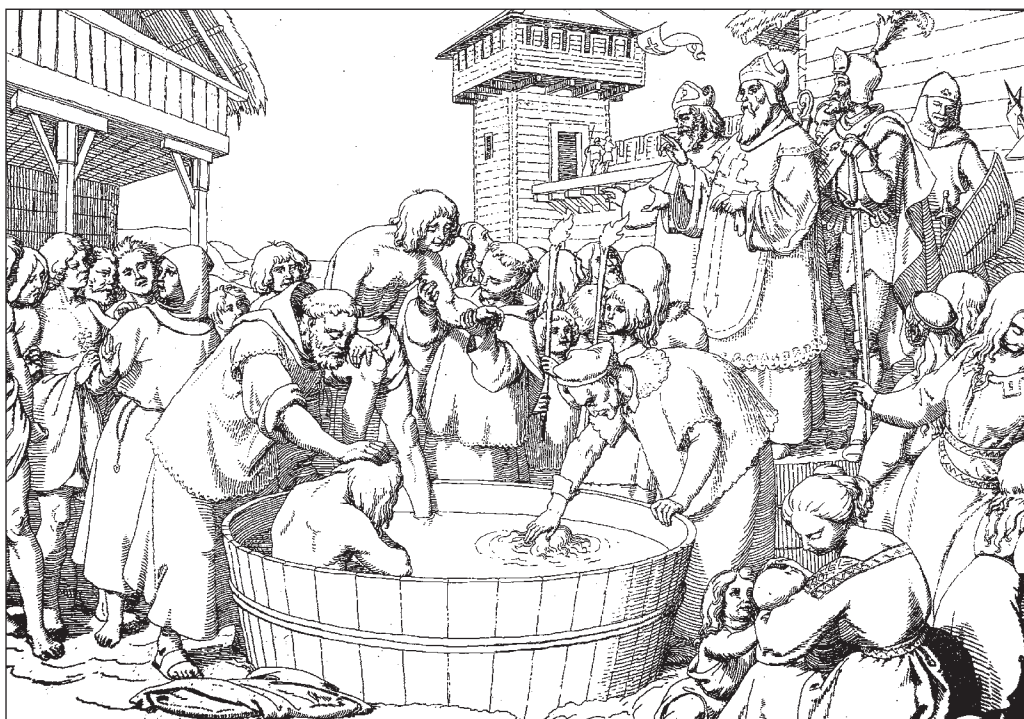
Piiskop Albert ristib saarlasi Valjalas. Fragment Friedrich Ludwig von Maydelli (1795–1846) vaselõikest

ja pööramist. 2 Ürikuline ja muu sündmuste kaasaegne allikmaterjal on küll tagasihoidlikum, ent enamasti editeeritud ja mitte ainult saksa-, vaid ka eestikeelsesesse teaduslikku