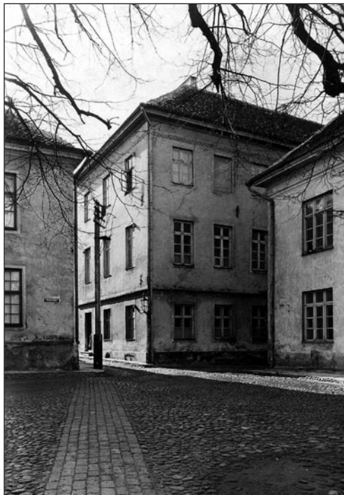
Tallinna Toomkooli hoone Toompeal (1920–1940).

Linna Saksa Reaalgümnaasium 10 klassiga, Linna 3. Saksa Tütarlastegümnaasium 8 klassiga, Linna 23. Saksa Põhikool 11 klassiga;