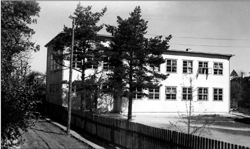
Nõmme saksa kooli uus hoone (1920–1940).