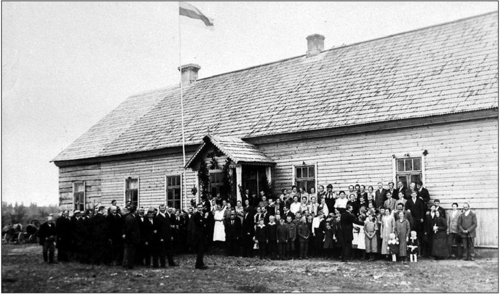
Heimtali koloonia saksa algkooli õpilased, õpetajad ja kohalikud elanikud koolimaja ees. EFA A-52-117

jalikuks väikelinnade koolide säilitamist, sest need moodustasid kohaliku saksa seltskonna kultuurielu keskpunkti. Nende likvideerimine oleks tugevdanud veelgi ebasoovitatavat tungi pealinna, kus olid paremad töövõimalused. 31 Juba olemasolevad koolid pidid saama kultuurvalitsusega kooskõlastatult võimaluse valida endale ühe ettenähtud koolitüüpidest. 32 Elementaar- ehk algkool hõlmas 1.–6. kooliaasta ja pidi olema aluseks kõigi keskkoolitüüpide jaoks. 5. ja 6. kooliaasta pidid kuuluma eelklassidena keskkooli ( Mittelschule ) juurde. Erinevad keskkoolitüübid pidid saama tugevalt kesksed õppeained, mis pidid olema vastava koolitüübi poolt antava üldhariduse põhialuseks. Keskkoolitüüpidena nähti ette klassikaline gümnaasium (ladina ja kreeka keel), ladinagümnaasium (ladina keel ja fakultatiivselt kreeka keel), uushumanitaargümnaasium (emakeel ja ajalugu), kõrgem reaalkool (matemaatika ja loodusteadused) ja tütarlastekool, hargnemisega uushumanistlikust gümnaasiumist 9.–11. kooliaastal