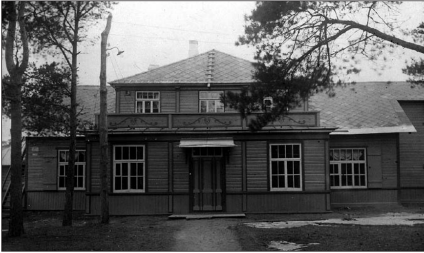
Nõmme saksa algkooli välisvaade (1920–1940). EFA K-9453/0-64757p