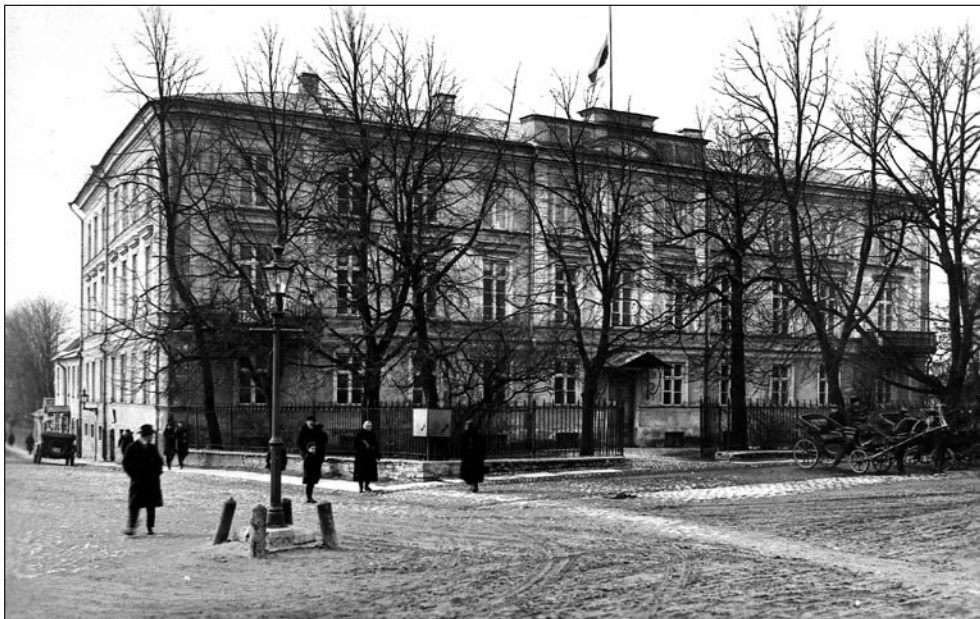
Saksa tütarlastegümnaasiumi Eliseskooli (Elisenschule) hoone (1920–1940) Tallinnas. EFA K-9317/0-64621p