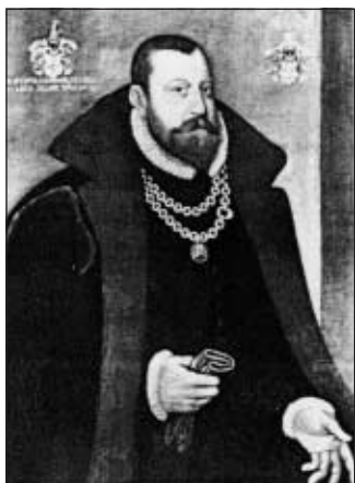
Jacob Ulfeldt, Taani riiginõunik (suri 1593. aastal)

Maasilinna, 1. juunil ületati Väike väin. Kuna Suuremõisa oli venelaste ja rootslaste poolt rüüstatud ja põletatud, pidid nad ööbima lageda taeva all. 2. juunil ületasid nad suure vaevaga Suure väina ja maabusid Läänemaal, kus venelased neid vastu võtsid. Nende arvates olid rootslaste väed lähedal ja seepärast polnud reisi Pärnu suunas võimalik kindlalt jätkata. Nii oli saatkond jälle sunnitud veetma kolm päeva lageda taeva all. Ulfeldt lisab, et kuna neile ei toodud muud söödavat kui kolm lammast, üks härg ja kaks kana, ning ei midagi joodavat, siis olid nende teenrid janu kustutamiseks sunnitud jooma vett.