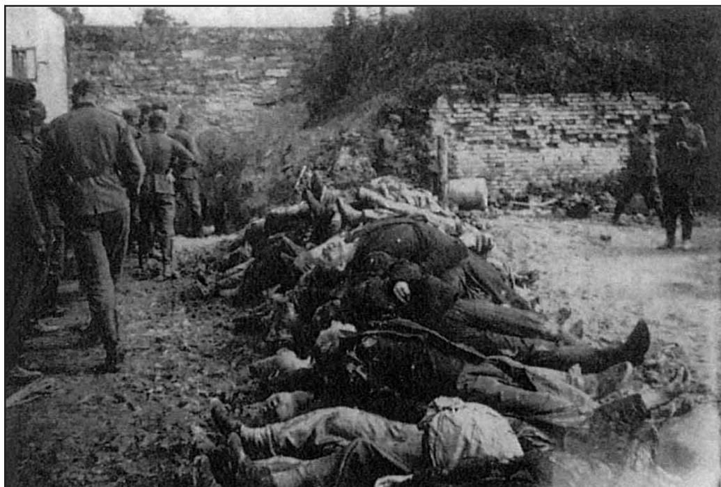
Fotod Złoczówi tsitadellis 1941. aasta suvel välja kaevatud NKVD ohvrite laipadest, mida näitusele esitleti Wehrmachti ohvritena