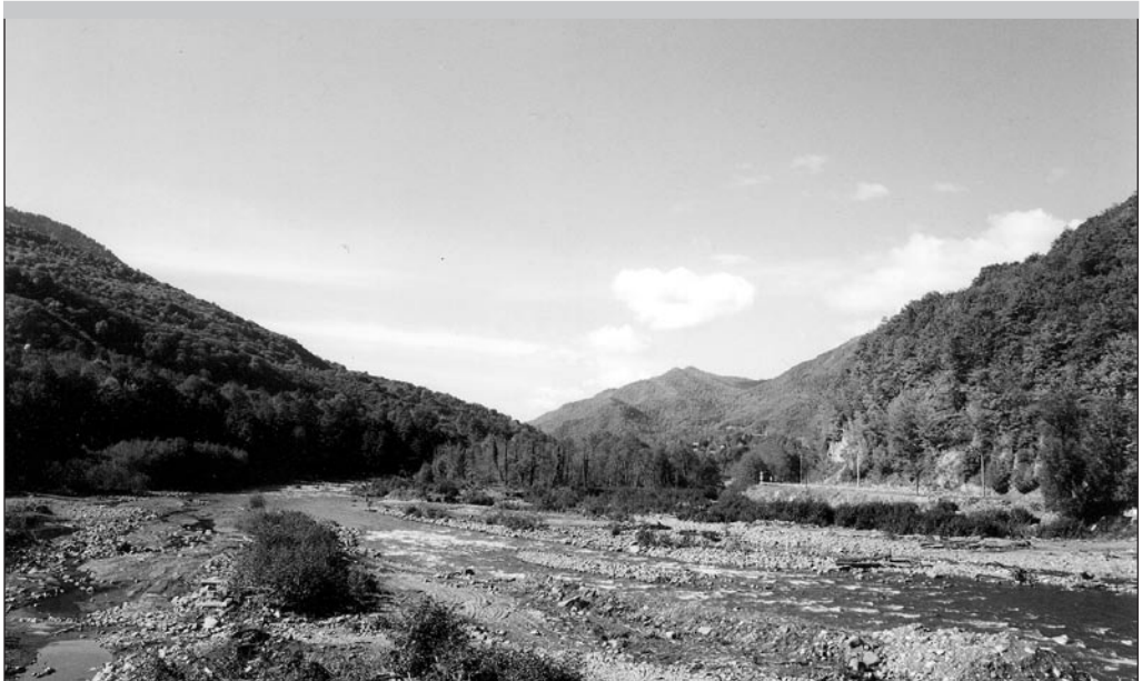
Mžõmta jõgi Eesti-Rohuaias.