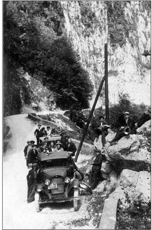
Salme või Sulevi pasunakoor teel koju pärast külaskäiku Eesti-Rohuaeda. 1930. aastad.

8. novembril. Jälle need oktoobripühad lähevad varsti mööda, täna on 8. ja ka viima-