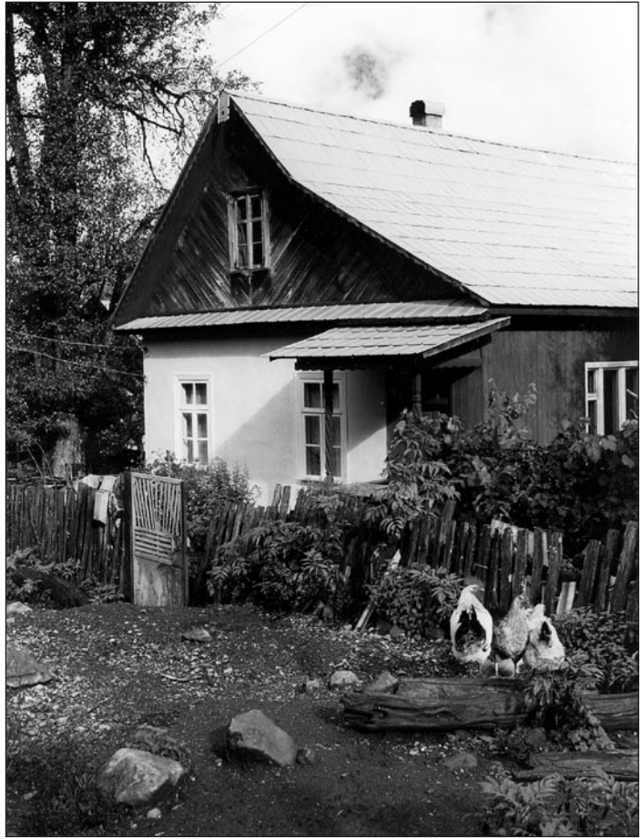
Rootside maja Eesti-Rohuaias. Foto: Marika Mikkor, 1999

7. märtsil. Elu läheb endiselt. Tali hakkab ka juba taganema, vastu päeva mäed on juba paljad. Meil on ikka lund kaunisti, tükati läheb juba. Välist tööd pole saand veel midagi teha.