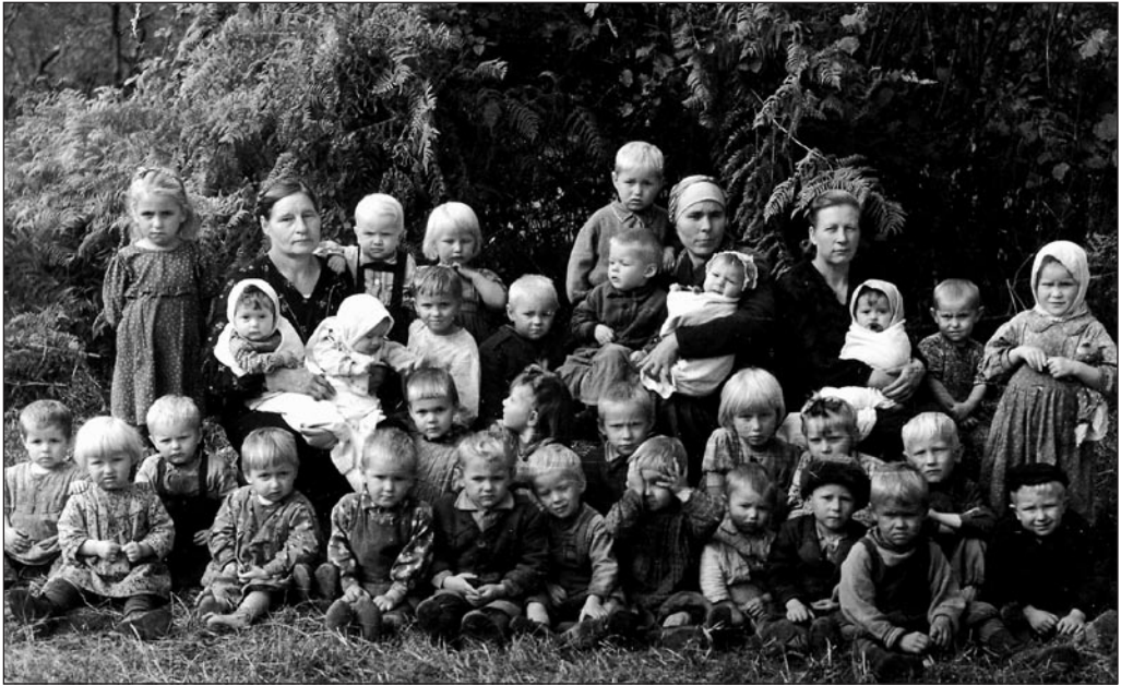
Kolhoosi lasteaid 1940. aastate alguses.

4. oktoobril. Olen juba teist päeva haige, ei ole pravlenja ligigi läind. Saab näha, mis sellest asast tuleb, kui nüüd lahti saan, siis enne paari aastat ei hakka ühegi vastutava ametisse.