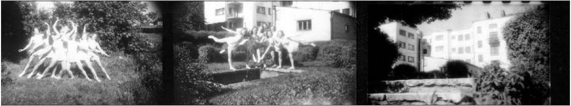
Tõnismägi 16 iluaia poolt.