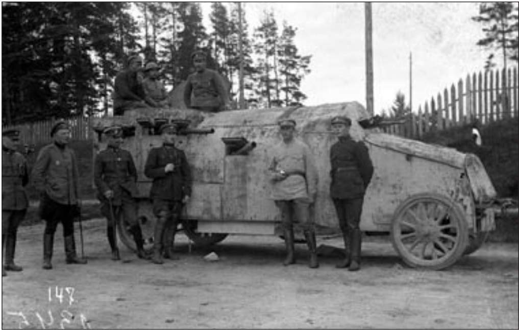
Soomusauto „Vanapagan“ ehitasid Pärnu mehed oma algatusel 1919. aasta algul 6. polgule. Asjaosaliste sõnul oli see küll „põlve otsas suure haamriga kokku taotud“, kuid polguülema kapten Tallo hinnangul „igas lahingus mõjus soomusauto ilmumine iseäranis tõstvalt sõdurite meeleolu peale, sest nad teavad, et „Vanapagan“ neil igal pool kaasas on ja parajal ajal neid toetama saab.“ EFA 3-1345