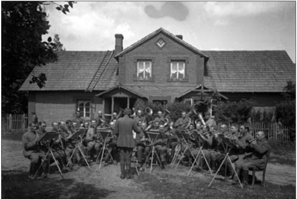
1. polgu orkester mängib Riia rindel 1919. aasta suvel. EFA 4-2668