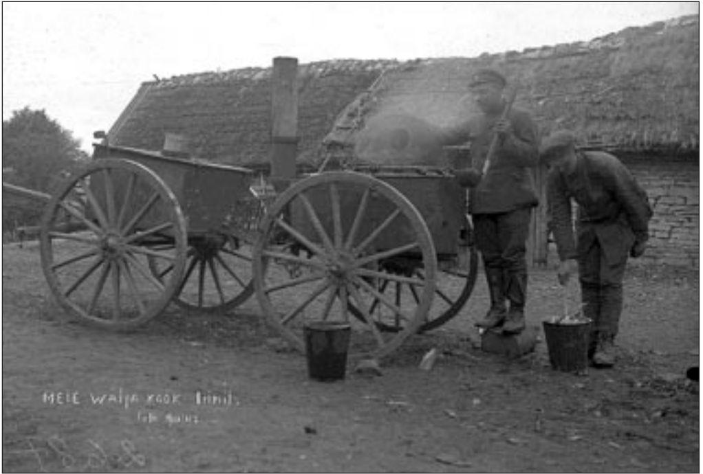
Väliköök rindel 1919. aastal. EFA 4-2687