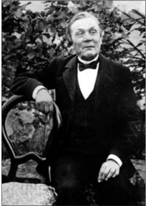
Märt Mitt 70-aastasena. Ülesvõte aastast 1904.