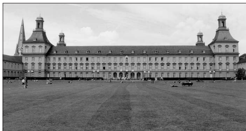
Bonni ülikool.

plommidega. Muuseumi juhatus võttis arhiivi alahoidmiseks vastu ainult kahel tingimusel: 1) kastid pidid kogu nende deponeerimise ajal muuseumis jääma kinniplommituks ja 2) juhtumil, kui vene väed peaksid olema sunnitud Moskvast lahkuma (!), ei võta muuseumi juhatus enesele enam mingit vastutust Tallinna arhiivi eest. Septembri alul tuli arhivaar tagasi Tallinna. Nüüd algas arhiivile Moskvas paabeli vangipõli. Sää! viibis ta tervelt 5 aastat. 12