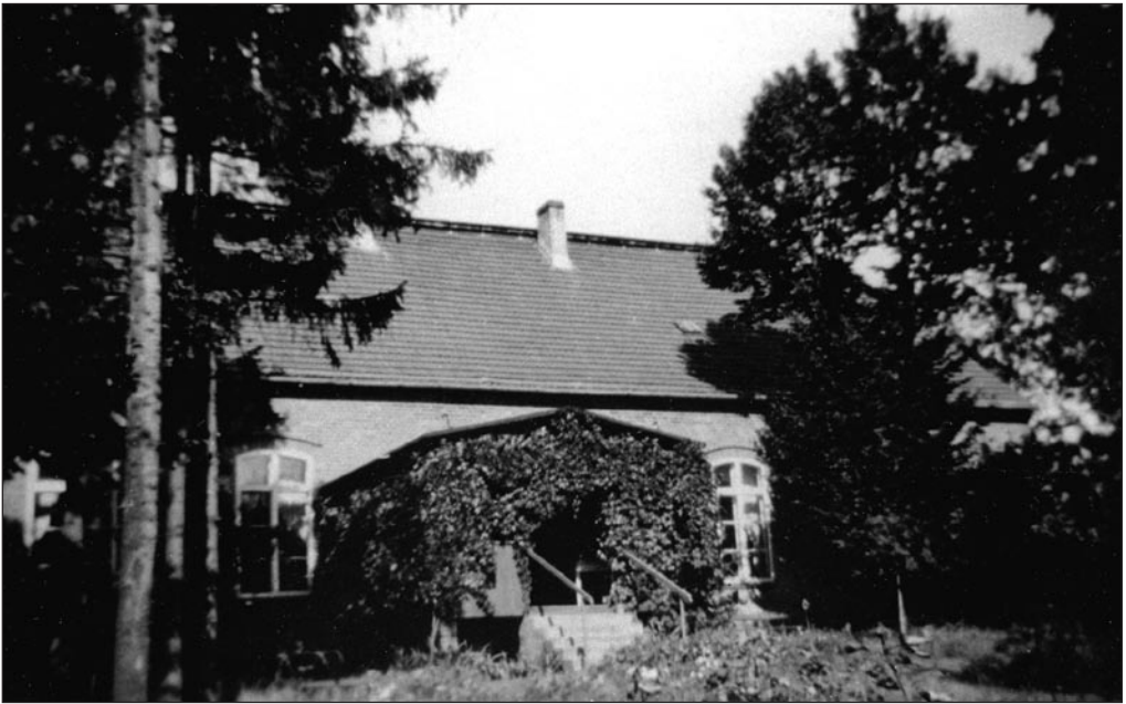
Saaremaalt ümberasunute vanadekodu Warthegaus.