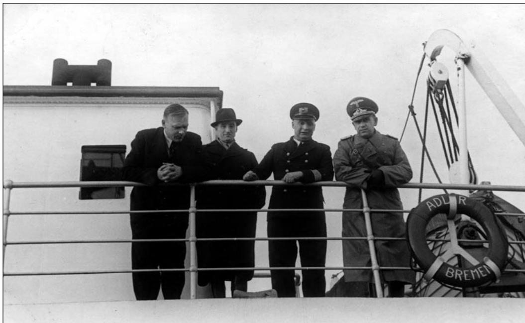
Aurik "Adler", millega lahkusid sakslased 1939. aastal. Lähivaade neljale mehele.