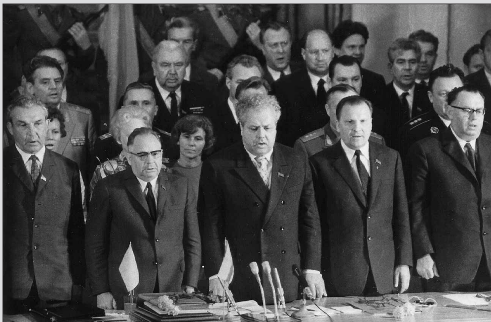
On aasta 1971, mil Hruštšovi "sula" möödab ja otsas on illusioonidki – suuresti Ungari 1956. ja Tšehhi 1968. aasta sündmuste tõttu. Fotol on reas kauaaegsed ENSV juhid, nende seas Moskva otsene käepikendus EKP II sekretär Konstantin Lebedev (paremalt esimene). Esireas vasakult: ENSV Ministrite Nõukogu esimees Valter Klauson, EKP Keskkomitee I sekretär Johannes Käbin, ENSV Ülemnõukogu Presiidiumi esimees Artur Vader. Tähistatakse pidulikult EKP 50. aastapäeva "Estonia" kontserdisaalis.