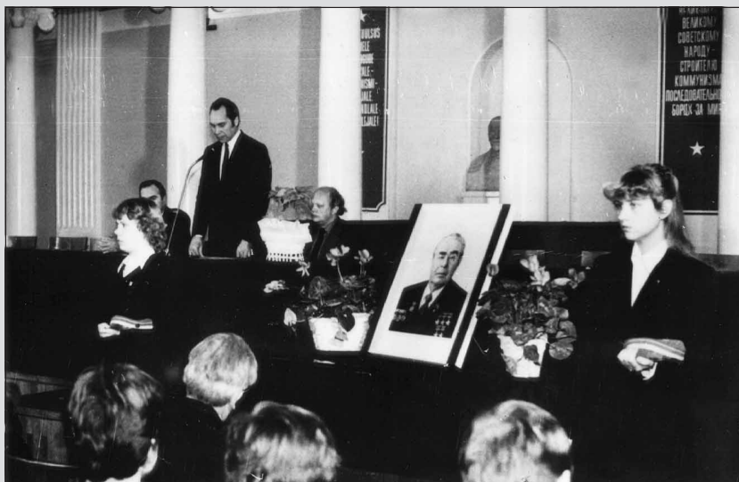
Leinamiting L. I. Brežnevi mälestuseks Tartu Riiklikus Ülikoolis. 1982. aastal algas ärev aeg suures Nõukogude impeeriumis – M. Gorbatšovi "perestroika" 1985. aastal andis Eestile uusi võimalusi. 0-114426