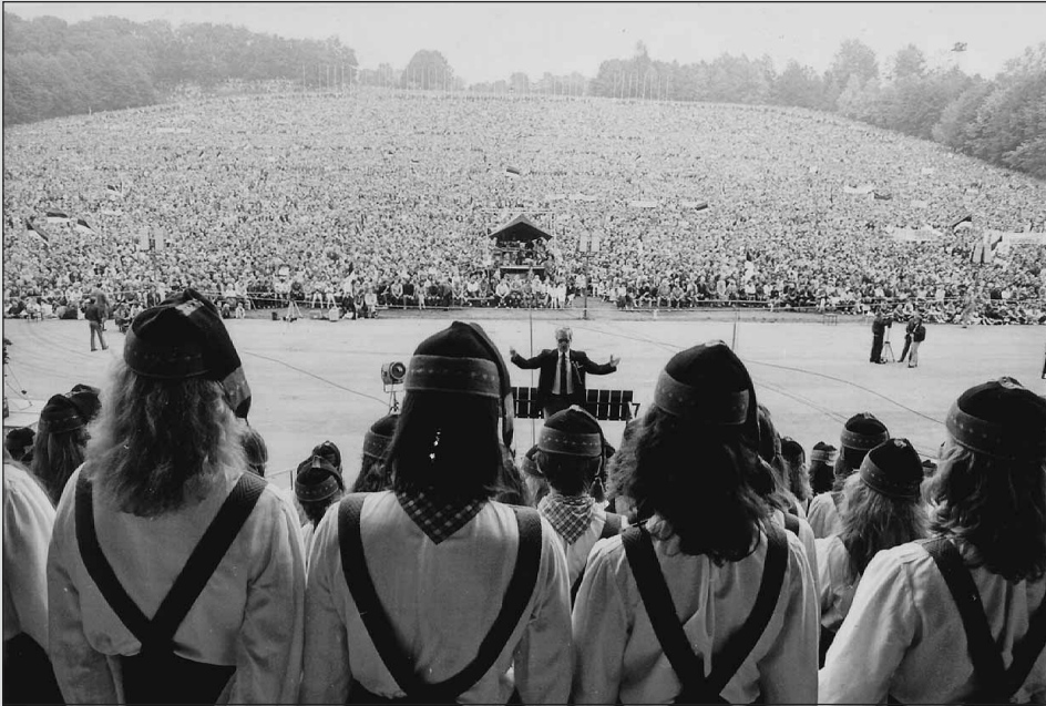
"Laulev revolutsioon". Toimub suurüritus "Eestimaa laul '88" 12. septembril 1988, mil Laulväljak mahutas ära rekordarvu eestlasi. Suurejoonelisematest üritustest on veel ees Balti kett 1989. aastal. Eesti kuulutab end taas iseseisvaks 20. augustil 1991. 0-135454