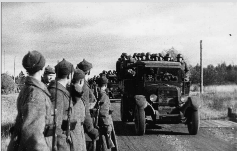
18. oktoobril avatakse Eesti riigipiir Punaarmeele. Fotol: Nõukogude väed saavad Eestisse. Juunis 1940 lavastatakse punapööre ja 6. augustil inkorporeeritakse Eesti Nõukogude Liidu koosseisu. Algab punane terror, mis saavutab kulminatsiooni 1941. aasta massiküüditamisega. 0-48697