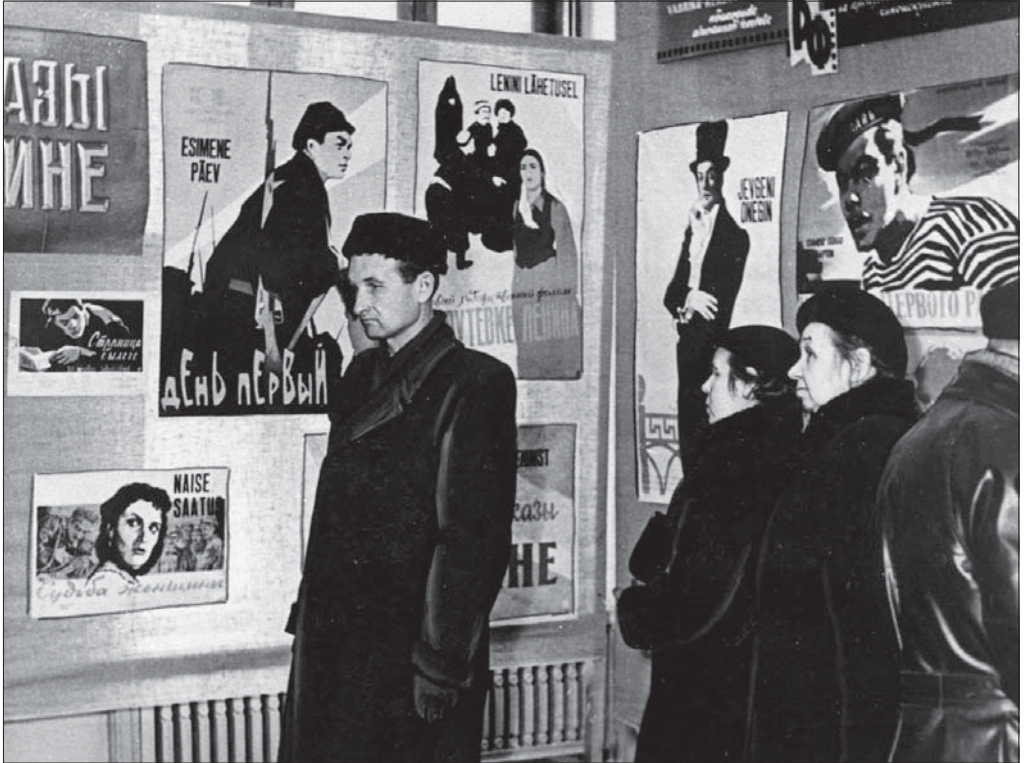
Kino "Sõprus" ooteruumis avatud esimene vabariiklik kunstilise kinoplakati näitus. Tallinn, 1959. EFA 0-31503