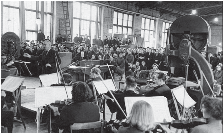
"Estonia" teatri kontsert Tallinna Masinaehitustehases novembris 1957. a. EFA 0-11895