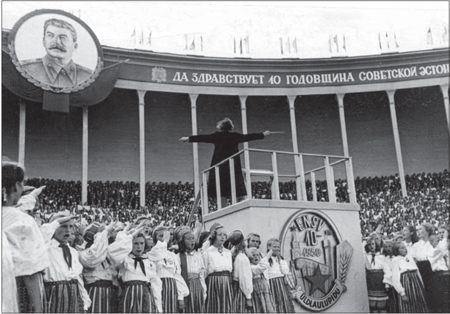
13. üldlaulupeol esinevad ühendkoorid. Tallinn, 26. juuli 1950. EFA 0-3355