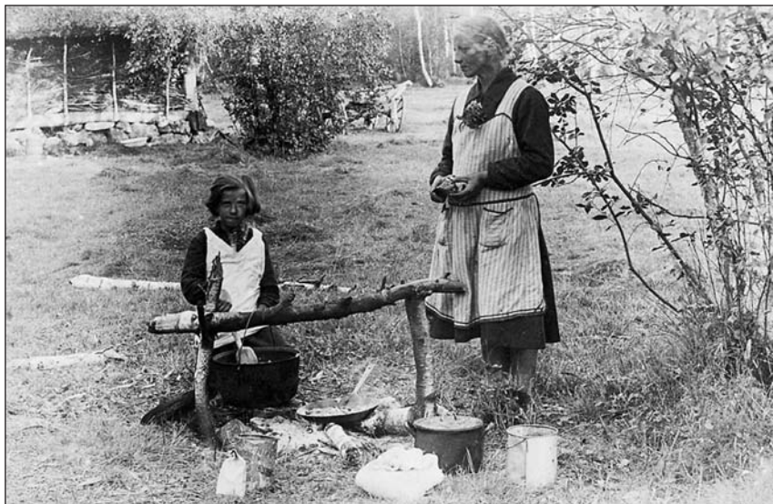
Heinalistele valmistatakse lõunat. Muhumaa, 1939.