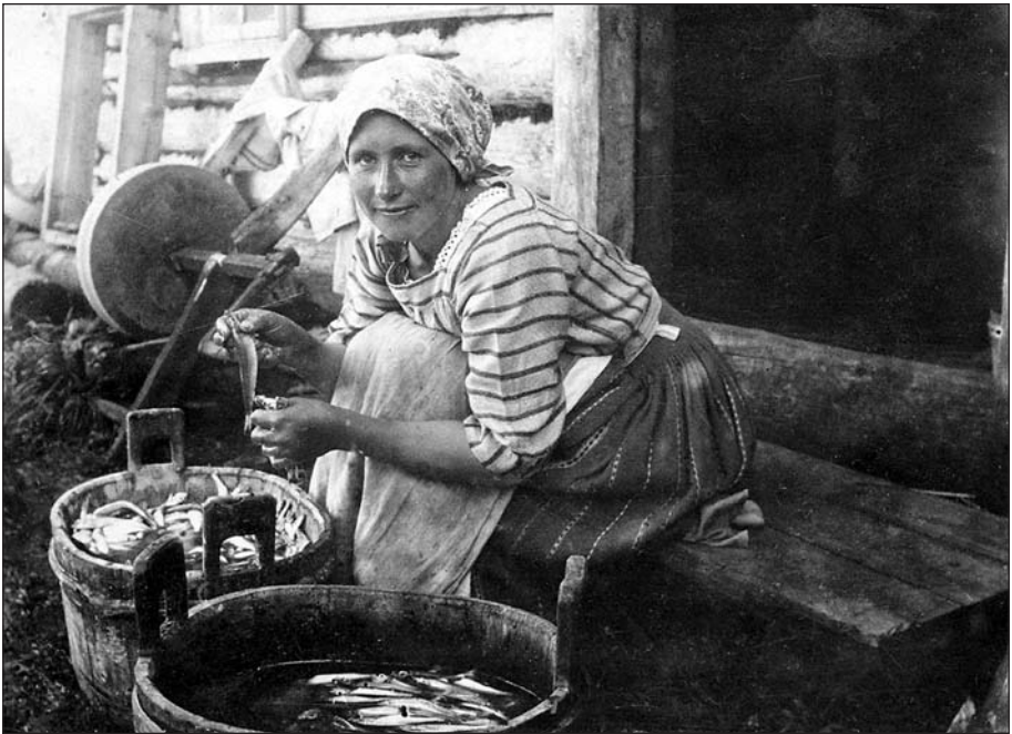
Kalapuhastamine Muhumaal 1939. a.