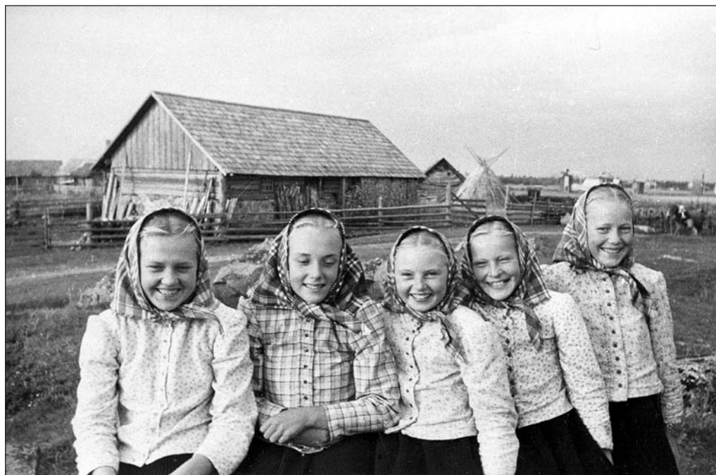
Vormsi neid 1940. a. EFA 0-37 957b