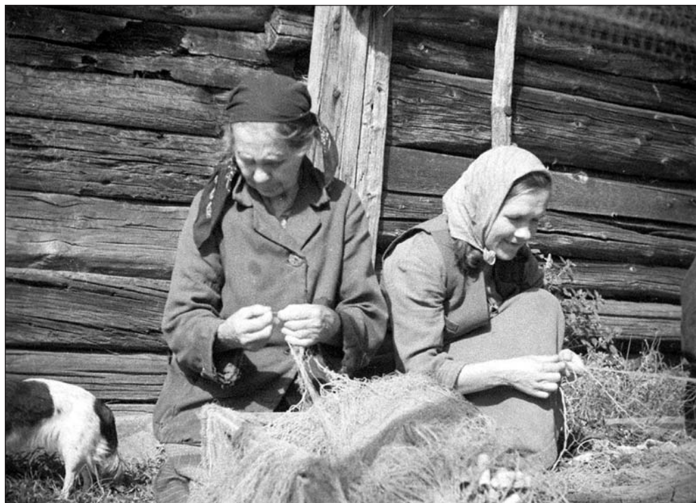
Kalade sorteerimine Saaremaal. Foto: C. Bulla 1911. a. EFA 0-99556