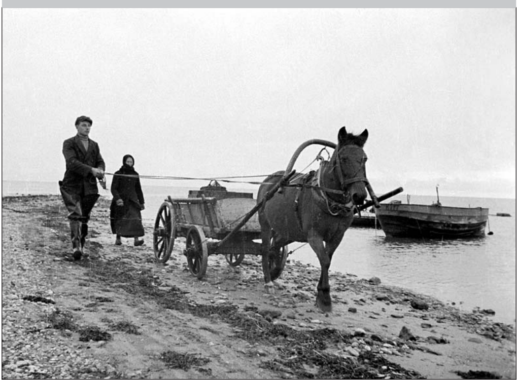
Kalurid põhjarannikul Harjumaal. Foto: K. Märsk 1936. EFA 0-130506

Ikka ja jälle küsitakse arhiivist fotosid ja filmikaadreid 1944. aasta paadipõgenikest ning paraku oleme sunnitud vastama eitavalt. Ehk oleks veel praegugi kohane pöörduda üleskutsega nende poole, kel niisuguseid fotosid on – tooge need meile arhiivi riiklikule säilitamisele, siis saavad ka järeltulevad põlvned neid 50–100 aasta pärast avaldada, olgu kas Tuna tüüpi ajakirjas või kooliõpikutes või virtuaalsel kujul. Originaalfotosid ei pea käest ära andma, sest neid saab arhiivis ümber pildistada.