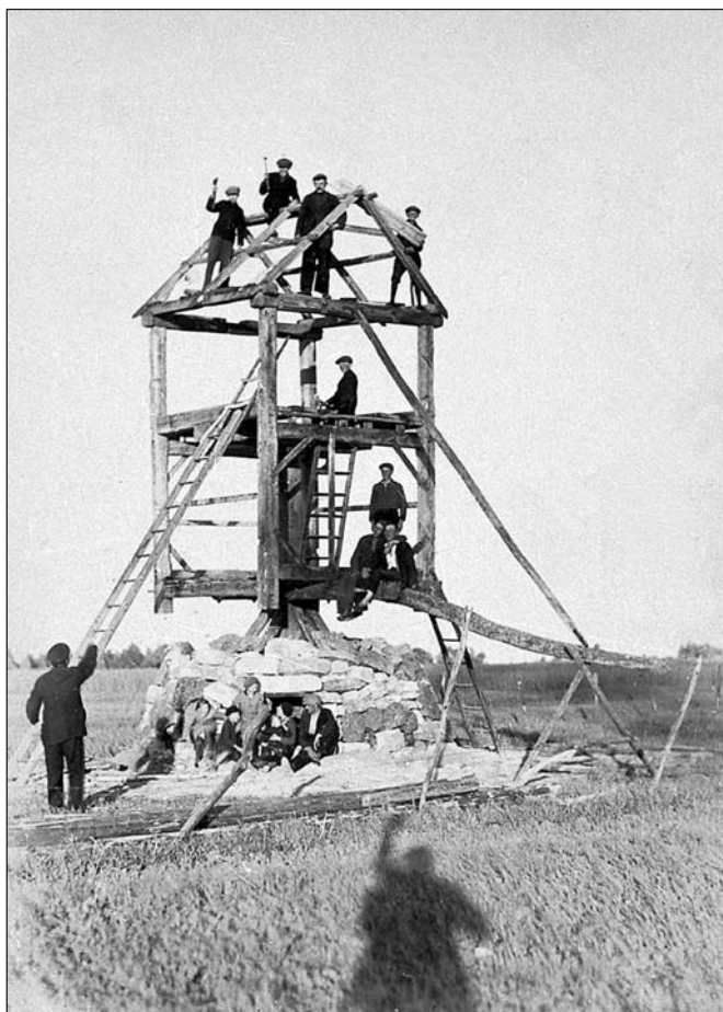
Puktuuliku ehitus Saaremaal Valjalas 1927. a. EFA 0-121 120