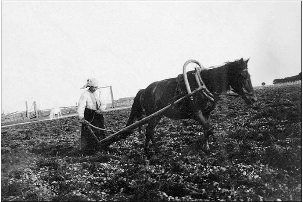
Naine künnab põldu. Saaremaa. 1911. a. EFA 0-99559