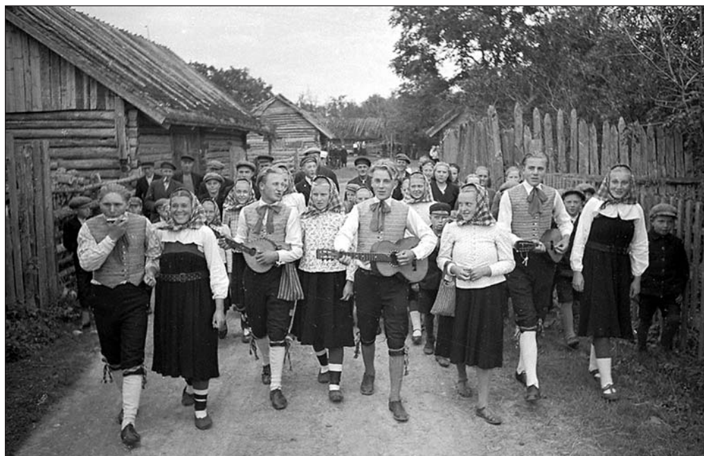
Külapidu Vormsil. EFA 037960