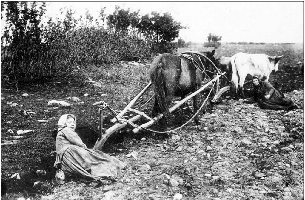
Puhkehetkel. Saaremaa. Foto aeg dateerimata.