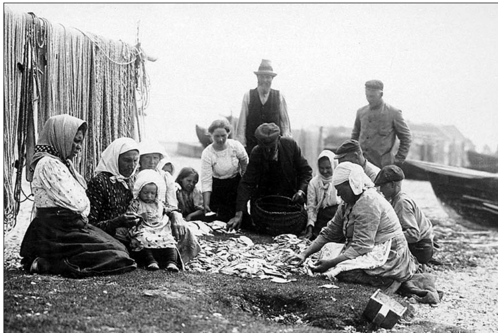
Naised võrkudega Saaremaal 1920-ndatel aastatel. EFA 0-130548