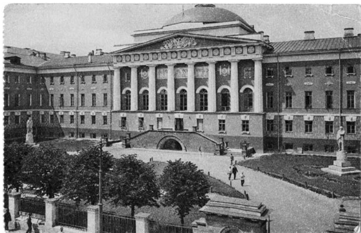
Stalini tervituspostkaart. ERAF, f. 395, n. 1, s. 105.